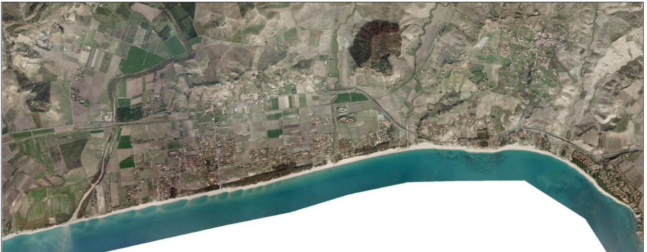
Figura 1 : Orto foto del territorio costiero del Comune di Cutro

La porzione di arenile oggetto di intervento per la definizione delle concessioni demaniali marittime è compresa tra la linea di costa e la linea di demanio marittimo, che varia da un valore di profondità irrisorio (circa 2 metri) fino ad un massimo di 200 metri lineari.